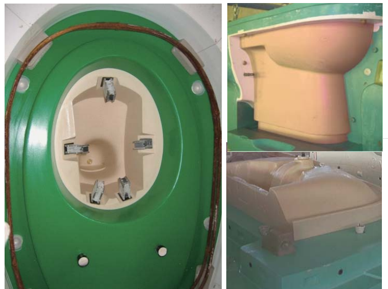
陶瓷母模表面无任何瑕疵

表面无收缩痕 浅杏色更易于察觉产品瑕疵 耐脱模剂化学腐蚀性强 易于表面磨砂处理 可操作时间长，操作简单 耐潮性能好